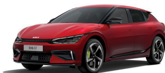
Runway Red (CR5) metallic