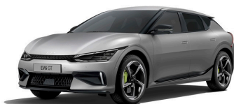
Moonlandscape (KLM) matt