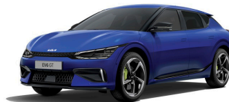
Yacht Blue (DU3) metallic