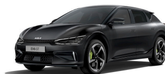
Aurora Black Pearl (ABP) metallic (pearleffekt)