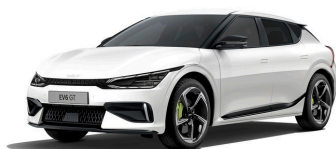
Snow White Pearl (SWP) metallic (pearleffekt)