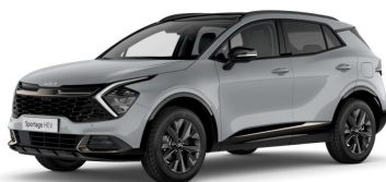
Wolf Grey (WAF) metallic