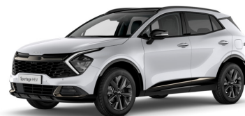
Delux White (HW2) pearl

Kia Sweden AB Kanalvägen 10A 194 61 Upplands Väsby Sverige Tfn: 08 - 400 443 00 www.kia.com