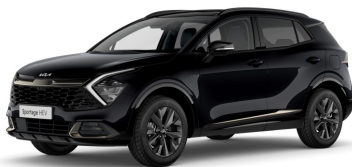
Black (1K) pearl