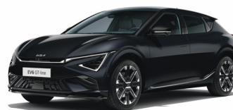
Aurora Black Pearl [ABP] metallic (pearleffekt)