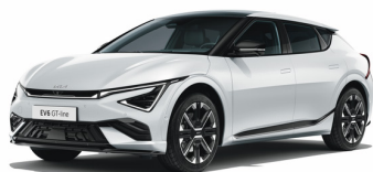
Snow White Pearl [SWP] metallic (pearleffekt)