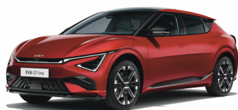
Runway Red [CR5] metallic