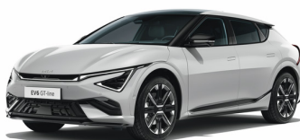
Wolf Gray [C7S] metallic