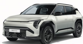
Ivory Silver [ISG] metallic