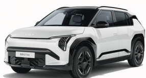
Clear White [UD] solid