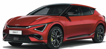
Runway Red [CR5] metallic