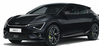
Aurora Black Pearl [ABP] metallic (pearleffekt)