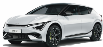
Snow White Pearl [SWP] metallic (pearleffekt)