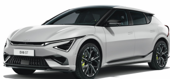
Wolf Gray [C7S] metallic