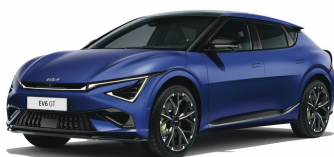
Yacht Blue [DUM] matt

OBS! Kräver handtvätt med bilschampoo för mattlack.