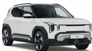
Cassa White [WD] solid EV2 / Plus