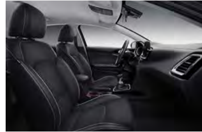
Svart interiör med svart artificiell delläderklädsel. Invändiga detaljer i matt aluminium- och blanksvart finish (Advance Plus)