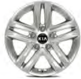
16 " aluminiumfälg (Action)