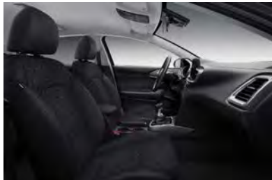
Svart interiör med svart tygklädsel. Invändiga detaljer i matt kromfinish (Action & Advance)