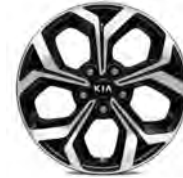
17 " aluminiumfälg (Advance)