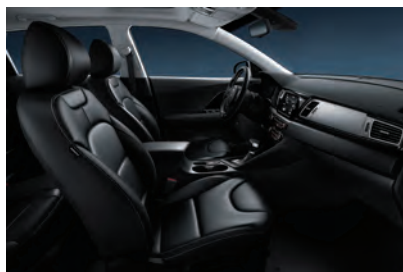
Saturn Black (std. PlusPaket 1) Svart delläder, paneler i svart pianolack