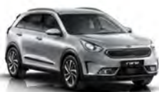
Silky Silver (4SS) metallic