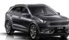
Platinum Graphite (ABT) metallic