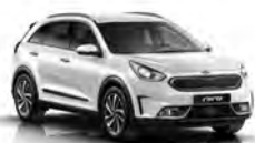
Snow White Pearl (SWP) metallic (pearleffekt)