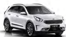
Clear White (UD) solid