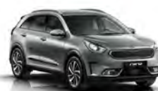
Steel Grey (KLG) metallic