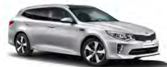
Silky Silver (4SS) metallic