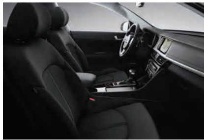
Svart tygklädsel (Advance)