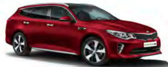
Runway Red (CR5) metallic