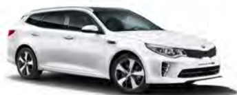
Clear White (JD) solid

*Bilderna nedan visar föregående modell och uppdateras vid senare tillfälle.