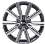
17 " aluminiumfälg (Advance)