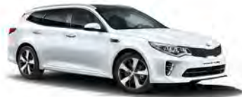
Snow White Pearl (SWP) metallic (pearleffekt)