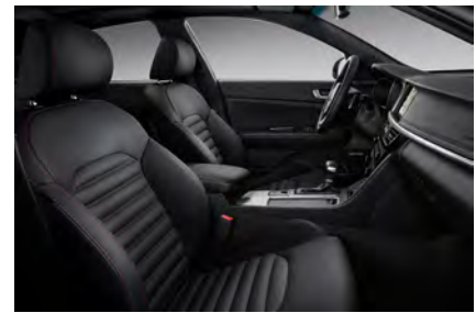
Svart läderklädsel med röda sömmar (GT Line)