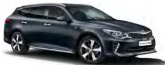
Platinum Graphite (ABT) metallic