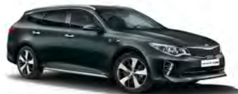
Moss Grey (M5G) metallic