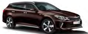
Pluto Brown (G4N) metallic