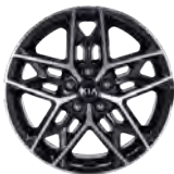
18 " aluminiumfälg (GT Line)