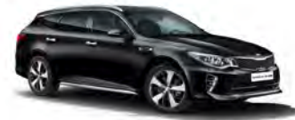
Aurora Black Pearl (ABP) pearleffekt