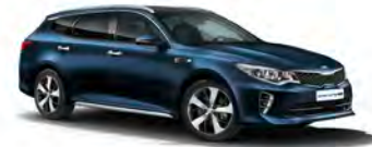
Gravity Blue (B4U) metallic

Kia Motors Sweden AB Kanalvägen 10A 194 61 Upplands Väsby Sverige Tfn: 08 - 400 443 00 www.kia.com