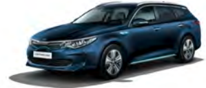
Gravity Blue [B4U] metallic