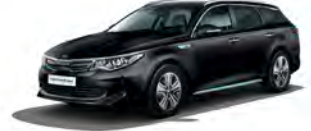
Aurora Black Pearl (ABP) metallic (pearleffekt)

Kia Motors Sweden AB Kanalvägen 10A 194 61 Upplands Väsby Sverige Tfn: 08 - 400 443 00 www.kia.com