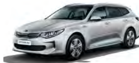
Silky Silver (4SS) metallic