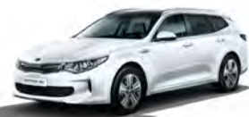
Snow White Pearl (SWP) metallic (pearleffekt)