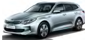
Aluminium Silver (C3S) metallic