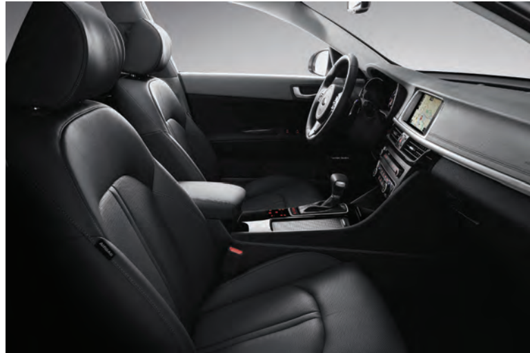
Svart interiör med svart läderklädsel (std.)