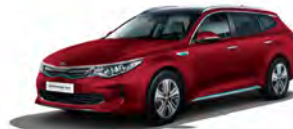
Temptation Red (K3R) metallic