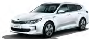
Clear White (UD) solid