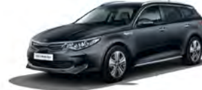
Platinum Graphite (ABT) metallic