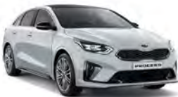
Cassa White (WD) solid (Ej GT)