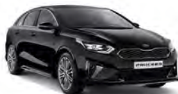
Black Pearl (1K) metallic (pearleffekt)