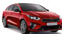
Infra red (FRD) metallic (Ej GT)