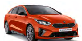
Orange Fusion (RNG) metallic (Specialfärg)

Kia Motors Sweden AB Kanalvägen 10A 194 61 Upplands Väsby Sverige Tfn: 08 - 400 443 00 www.kia.com