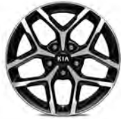
17 " aluminiumfälg (GT Line)