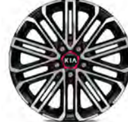
18 " aluminiumfälg med röd centrumkåpa (GT)