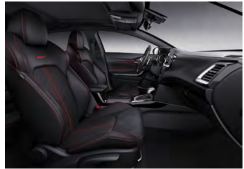
Svart interiör med Sportstolar och delläderklädsel med svart Alcantara och röda kontrastsömmar (GT)