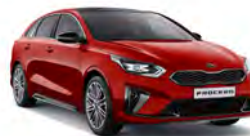
Track Red (FRD) Solid