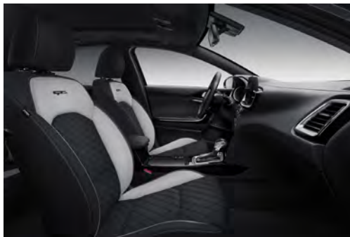
Svart interiör med artificiell delläderklädsel, quiltad i svart/ljusgrå med kontrastsömmar (GT Line)