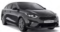
Dark Penta Metal (H8G) metallic