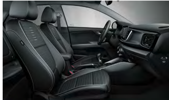
Svart interiör med svart delläder och grå kontrast-sömmar (konstläder). Instrumentpanel: detaljer i kolfiberfinish (GT Line)