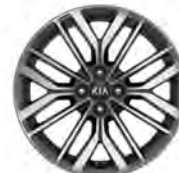
17 " aluminiumfälg (GT Line)