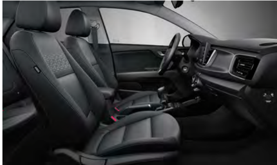
Svart interiör med svart tygklädsel (Advance)