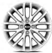
16 " aluminiumfälg (Advance)